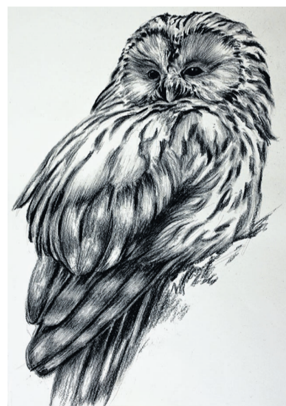
Nicht nur Menschen lassen sich porträtieren.