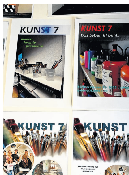
Eine Beschäftigung mit Grafikdesign.