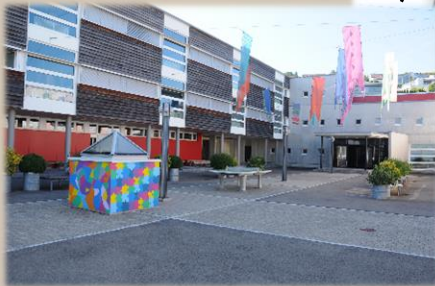
Talentschule Höfe in Wollerau