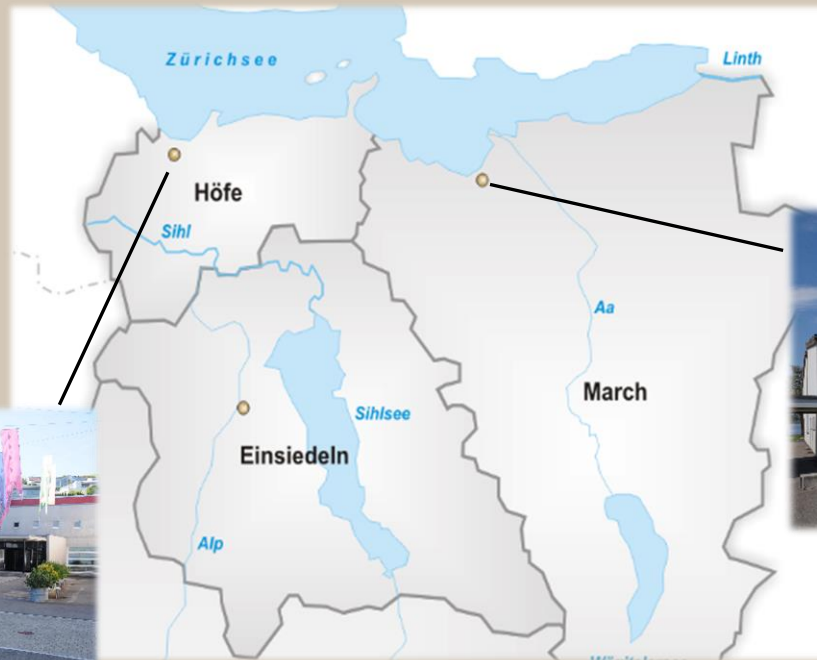
Talentschule March in Lachen