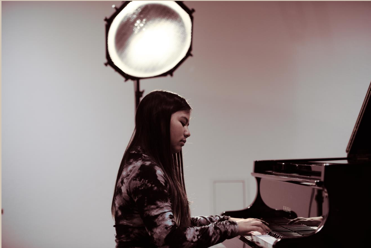
Schon Naomi, Klavier, Tasz 1, Standort March